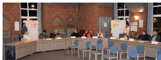
Workshop zur Halbzeitevaluation in der LAG-Sitzung am 23.02.2026

den Anwesenden diskutiert. Insbesondere zur Frage der Sichtbarkeit wurden verschiedene Ideen eingebracht, von Exkursionen zu bereits umgesetzten Projekten über eine verstärkte Pressearbeit bis hin zu einer intensiveren Nutzung sozialer Medien.