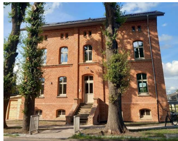
Villa Rotstein ( https://www.villa-rotstein.de/ )

Oyten sowie für PV-Anlagen auf den Gebäuden des Dorfvereins Eissel und des TV Oyten.