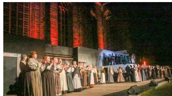
„Großer Beifall und etwas Wehmut nach der letzten Vorstellung“ Beitrag und Foto: Christel Niemann ( https://www.kreiszeitung.de/lokales/verden/verden-ort47274/grosser-beifall-und-etwas-wehmut-nach-der-letzten-vorstellung-93876375.html )

positives Presse-Echo waren der Lohn für die intensiven Vorbereitungen.