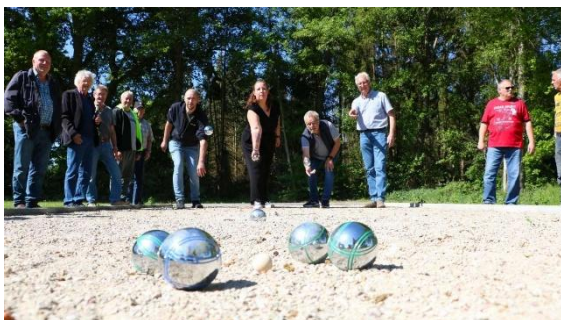
Eröffnung der Boulebahn, Foto: Walter ( https://www.kreiszeitung.de/lokales/verden/thedinghausen-ort50200/neue-boule-bahn-in-felde-ein-weiterer-baustein-hin-zum-dorf-gemeinschaftsplatz-93732862.html )

Über den Frühling und Sommer hinweg haben die Arbeiten an etlichen Projekten in unserer Region Fahrt aufgenommen. Eine besonders wichtige Wegmarke erreichte der Schützenverein Felde e.V., der schon am 14.05. 2025 seine neue Boule-Bahn feierlich einweihen könnte. Mit dem LEADER-geförderten Objekt ist das Freizeitgelände am Schützenhaus ab sofort um eine Attraktion für Jung und Alt reicher: