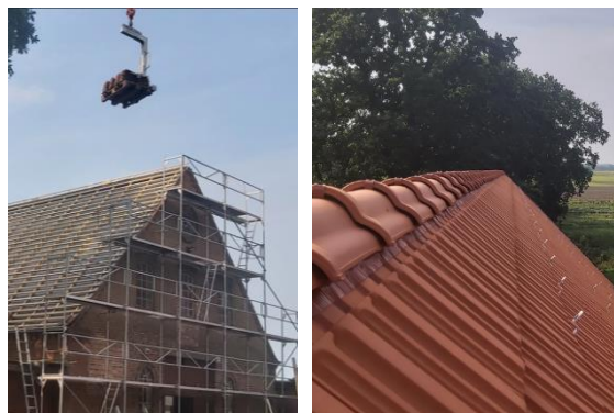
Dacherneuerung Hof Imhorst, Baustein des Vorhabens des Hofes Imhorst: „Treffpunkt.Gemüse.Kennen.Lernen“.

Während sich die einen über die Zustimmung der LAG zu ihrer Projektidee freuen, feiern die anderen schon den Fortschritt oder die Fertigstellung ihres Vorhabens. So ist seit einigen Wochen, die mithilfe einer LEADER-Förderung rundenerneuerte Website des Bürgerbusvereins Oyten online, die ihren Nutzer*innen nun übersichtlich über die Möglichkeiten dieses besonderen Mobilitätsangebots informiert. Gut voran geht es auch beim Projekt „Treffpunkt.Gemüse.Kennen.Lernen“ auf Hof Imhorst in der Samtgemeinde Thedinghausen. Das Dach des alten Stallgebäudes des Bio-Hofs wurde erneuert, dazu laufen Erdarbeiten und die Renovierung des Innenraums. In dem Gebäude sollen künftig große und kleine Gäste lernen, wie Lebensmittel ökologisch erzeugt und verarbeitet werden.